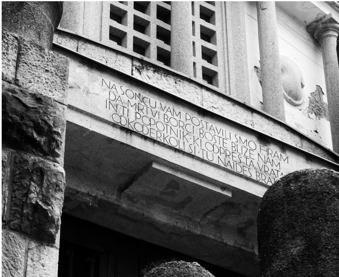
DETAJL VHODA V KOSTNICO

Kamnití vhodni del kostnice z vrezanim napisom, ki obiskovalca uvede v prostor spomina. Arhitekturni elementi poudarjajo mirnost in zadržanost prostora, namenjenega spominu na padle.